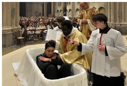
Baptêmes de la Veillée Pascale 2026