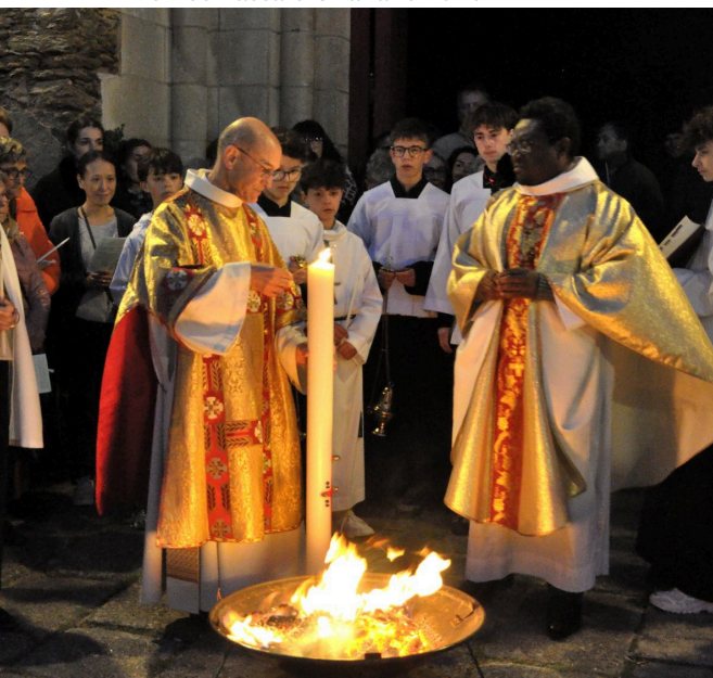
Veillée Pascale Challans 2026