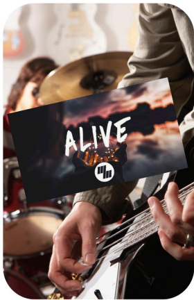
ALIVE ANIME LA MESSE