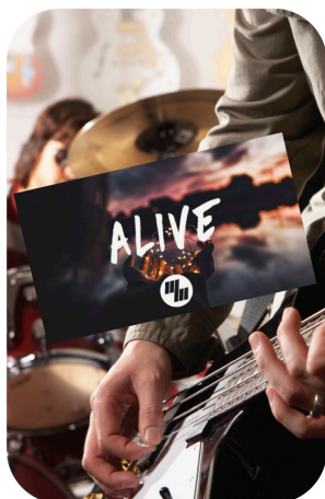
ALIVE ANIME LA MESSE

Samedi soir, le groupe Alive sera au service de la célébration du Seigneur. Merci à eux de vouloir ainsi servir le Christ et le chant de l'Assemblée.